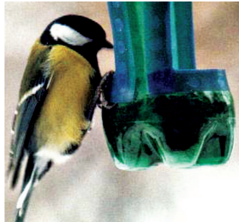
Пернатая подружка.

Очнувшись мальчик уже незрячим. Отец в ту пору был в плену, мать рыла окопы. Так